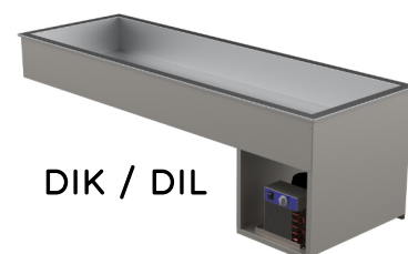
DIK / DIL