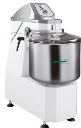
RH-12SL RH-18SL RH-25SL RH-38SL RH-50SL

Kiinteä kulho, vatkaisosa on nouseva. Lisävarusteet myydään erikseen. Saatavilla myös kahdella nopeudella, kysy lisää!