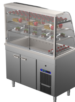
KL-1200 2TP KL-1200 3TP