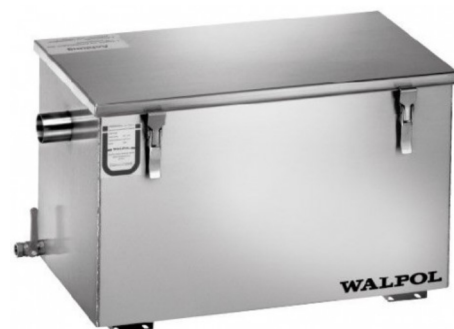
WNG-1 | WNG-2 | WNG-3

CE-todistukset sekä tarkemmat käyttöohjeet ladattavissa www.resthot.fi .