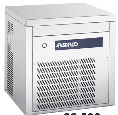
SG 300 SG 600

Jäämurskakoneiden säiliöt myydään erikseen. Kylmäaineena R452A. Saatavilla myös muita malleja ja lisävarusteita. Kysy lisää!