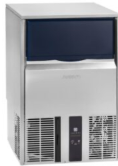
CP 40.15A CP 50.25A