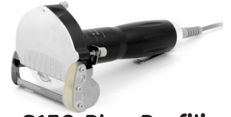
S150 Plus Profiline