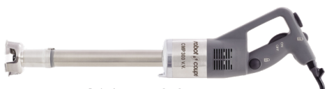
CMP 300 V.V.

Saatavilla myös muita malleja, kysy lisää!