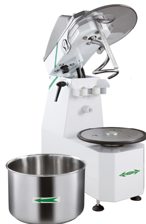
RH-12SR RH-18SR RH-25SR RH-38SR RH-50SR

Irroitettava kulho, vatkaisosa on nouseva. Lisävarusteet myydään erikseen. Saatavilla myös kahdella nopeudella, kysy lisää!