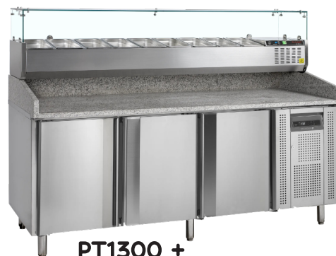
PT1300 + GVC38-200