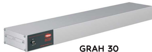
GRAH 30 GRAH 54