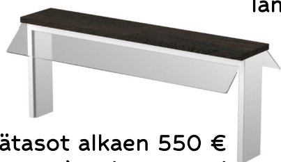
Tasainen + lämpösäteilijä

Ylätasot alkaen 550 € (alv 0%). Mitat drop-in- -hauteiden mukaan.