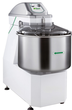
RH-12SB RH-18SB RH-25SB RH-38SB RH-50SB

Kiinteä kulho, vatkaisosa ei ole nouseva. Lisävarusteet myydään erikseen. Saatavilla myös kahdella nopeudella, kysy lisää!