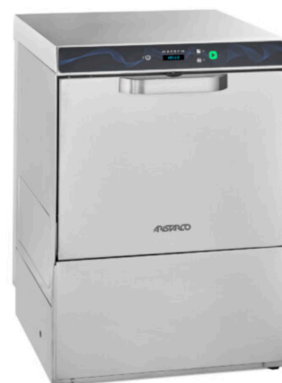
AF 50.35 ESI M AF 50.35 ESI

Poistopumppu ei sisälly hintaan (180 € alv 0%). Hinta sisältää huuhteluaineannostelijan.