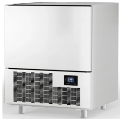
ENTRY 5 UC PÖYDÄNALUSMALLI