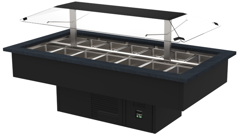
SUPREME 14 GN HINTA ALK. 11,000 € (alv 0%)