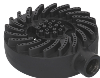
Polttimet: 9,5 / 14 / 21 kW