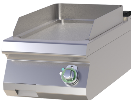
FTH 704 E