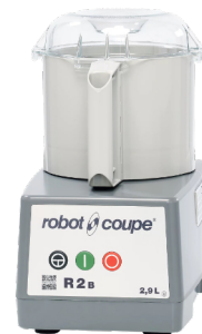
R 2 B