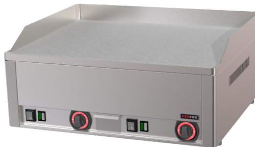
FTHC 60 E