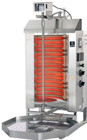
POTIS E2 POTIS E3