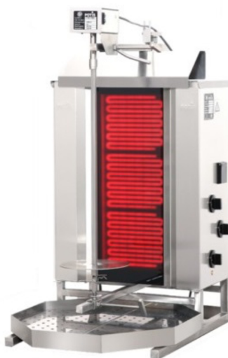
POTIS CE2 POTIS CE3