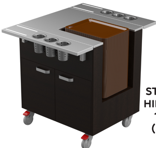
STV P 800 HINTA ALK. 1,659 € (alv 0%)