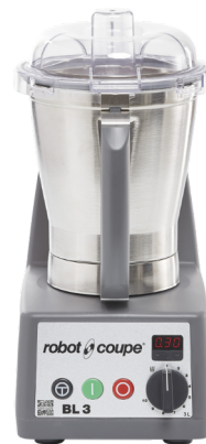
BL 3 BL 5

Säädettävä nopeus molemmissa malleissa 500 - 12600 rpm.