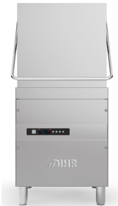
HT12 Electron 2