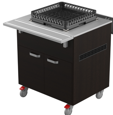
BTV 800 HINTA ALK. 2,359 € (alv 0%)