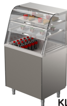
KL-800 2TP KL-800 3TP

Saatavilla myös muita malleja, kysy lisää!