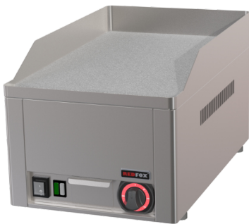
FTHC 30 E

Saatavilla myös muita malleja, kysy lisää! Jalustat myydään erikseen.