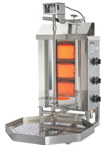
POTIS G2 POTIS G3