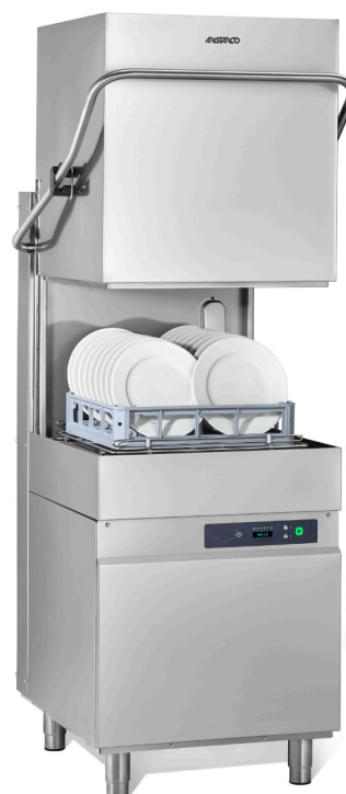
AH 800 ESI HD