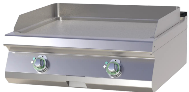
FTH 708 E